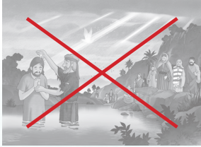
圖一（第 133 頁）

謝謝大家購買本套《童心飛躍 1：信仰互動教材》，本編輯部發現教師本內，有三處內容需要修正，我們已把修正的插圖及文字製作成貼紙，供已購買教師本的讀者索取，讀者可以經由電郵 tph.editor2@gmail.com 通知本社把貼紙郵寄給你或到本社索取。